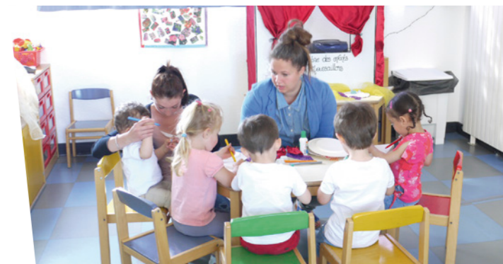
Les stages, découverte du milieu professionnel et acquisition de compétences