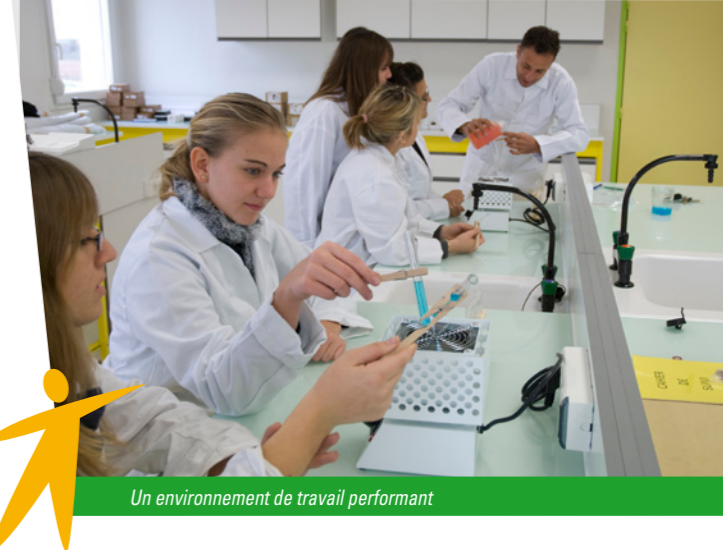
Un environnement de travail performant