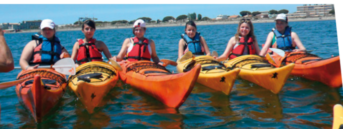
Les activités de pleine nature, support pédagogique

Mon engagement pour les Maisons Familiales Rurales trouve ses racines dans la réussite de mes enfants par cette alternative éducative. Convaincu que ce projet peut participer à l'épanouissement de nos jeunes, je souhaite permettre à d'autres familles de partager au sein de notre Maison un espace d'éducation original.