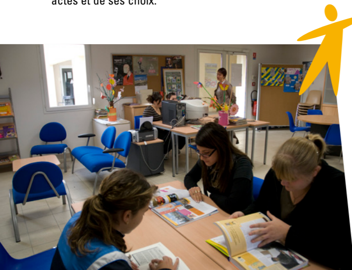
Une ambiance de travail studieuse et agréable

Le parcours de développement personnel proposé par la MFR mobilise une implication forte et un regard fréquent sur soi. L'internat, les activités de cours, le travail en entreprise sont faits de relations avec d'autres jeunes, avec des adultes, avec des partenaires. Les erreurs sont possibles, les efforts nécessaires pour grandir et s'intégrer. La MFR permettra souvent à chaque jeune d'éprouver la responsabilité de ses actes et de ses choix.