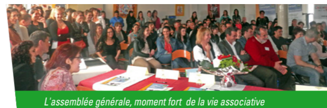
L'assemblée générale, moment fort de la vie associative