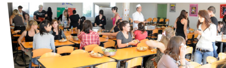
Les repas, temps de partage