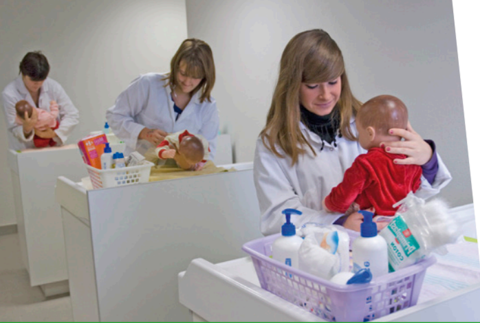
Les travaux pratiques, acquisition des bases des pratiques professionnelles